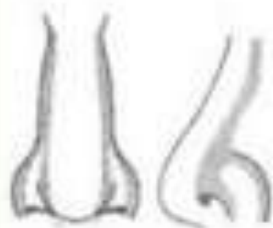
маленький и короткий нос